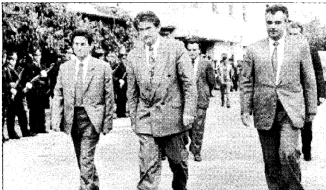
Kopliku me Berishën, në 70-vjetorin e Policisë së Shtetit

Qe njëzë i pavarur brenda PDSH; kontribuoi kryesisht në programimin e reje formave ekonomike të zbatuara gjatë viteve 1991-1997; I është kundërvënë PDSH për piramidat financiare, që në fillimin e vitit 1996.